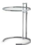
ADJUSTABLE TABLE E 1027 1927