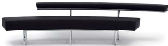
Leder schwarz leather black

Estructura de tubos de acero cromado. Marco de madera de haya acolchado con bandas de goma, poliuretano con espuma. Tapicería de tela o cuero. Detalles y colores ver lista de precios.