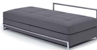
DAY BED 1925